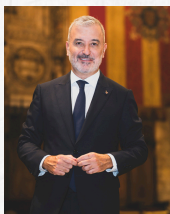
Jaume Collboni Cuadrado L'Alcalde de Barcelona