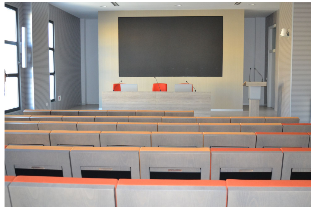
Sala de Conferencias Edificio Ciencias Económicas y Empresariales UAL