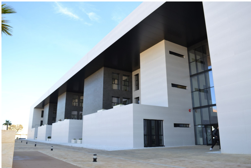
Edificio Ciencias Económicas y Empresariales UAL